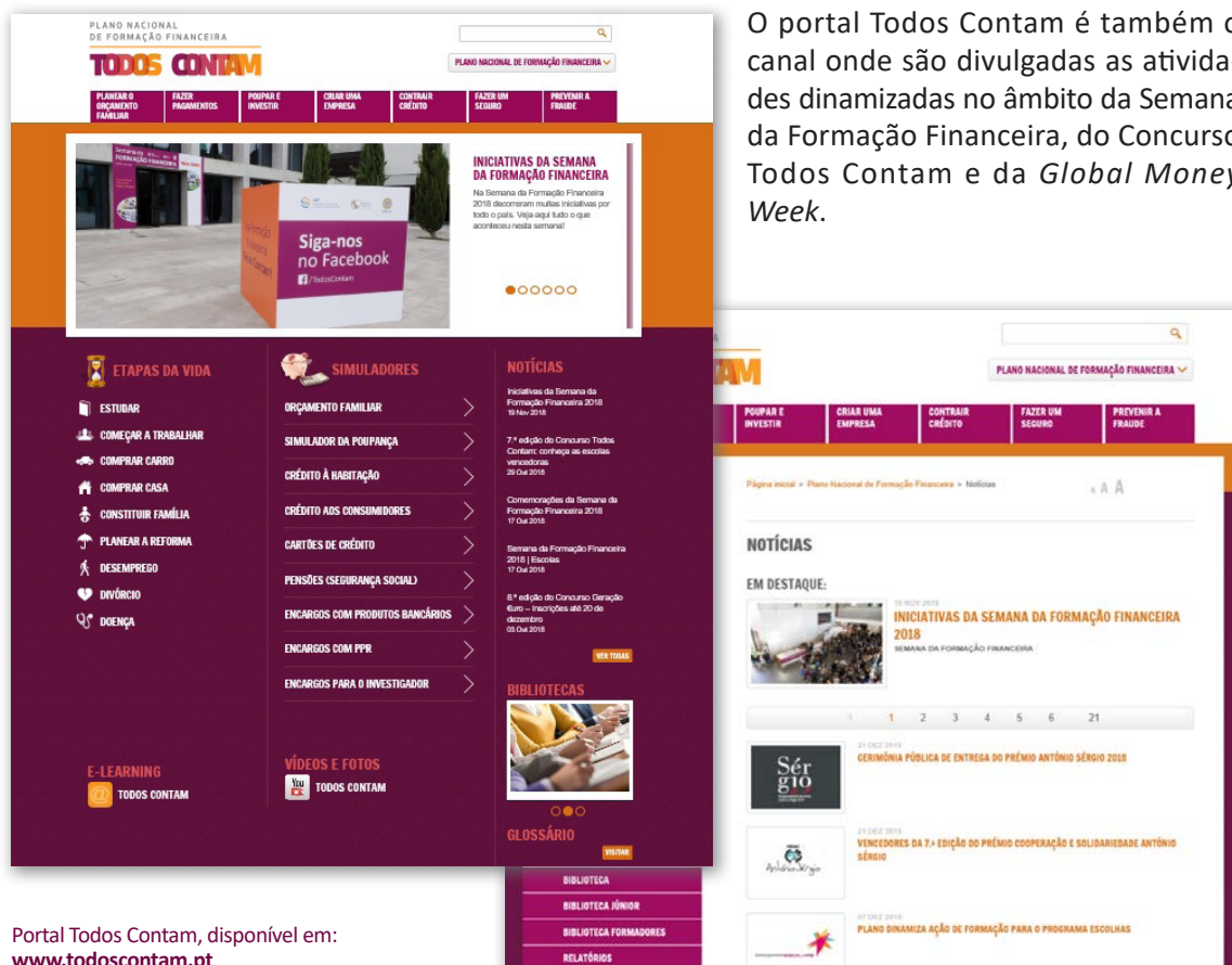
Portal Todos Contam, disponível em: www.todoscontam.pt

O portal Todos Contam é também o canal onde são divulgadas as atividades dinamizadas no âmbito da Semana da Formação Financeira, do Concurso Todos Contam e da Global Money Week .