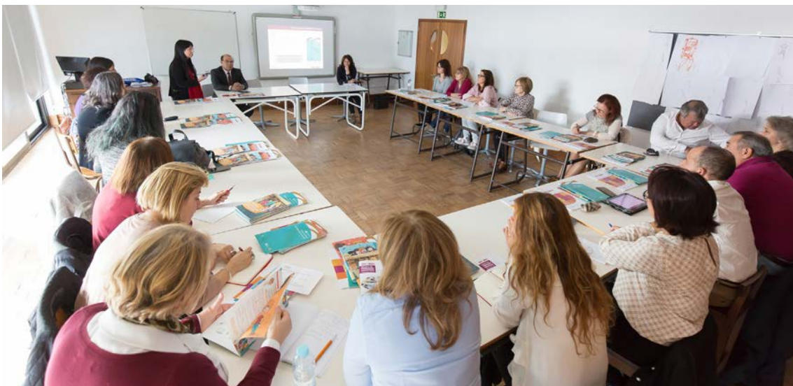
Curso de formação na Escola Secundária de Pombal.