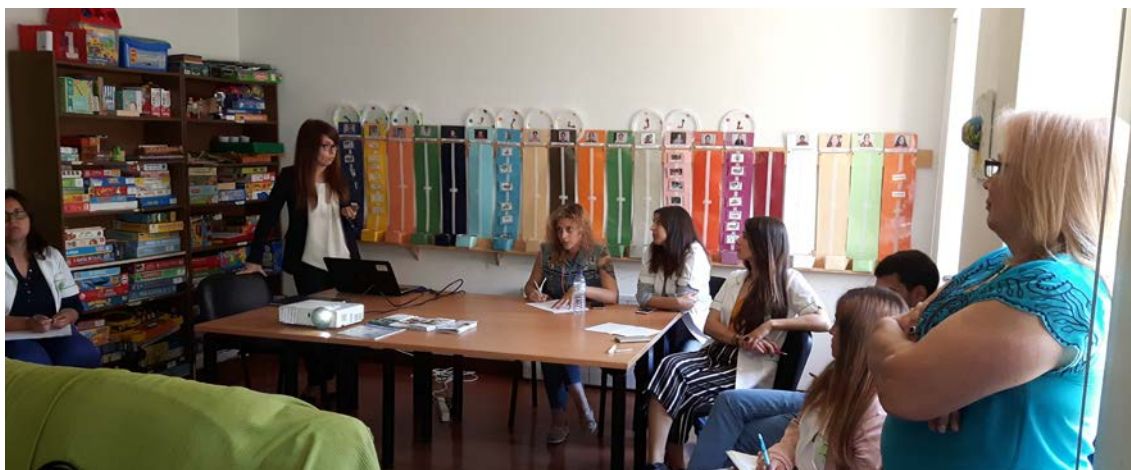
Sessão de formação da LEQUE.

Na sessão de formação realizada pelos supervisores financeiros foram abordados temas de planeamento e gestão do orçamento familiar, criação de empresas, financiamento bancário, financiamento colaborativo – crowdfunding – e seguros.