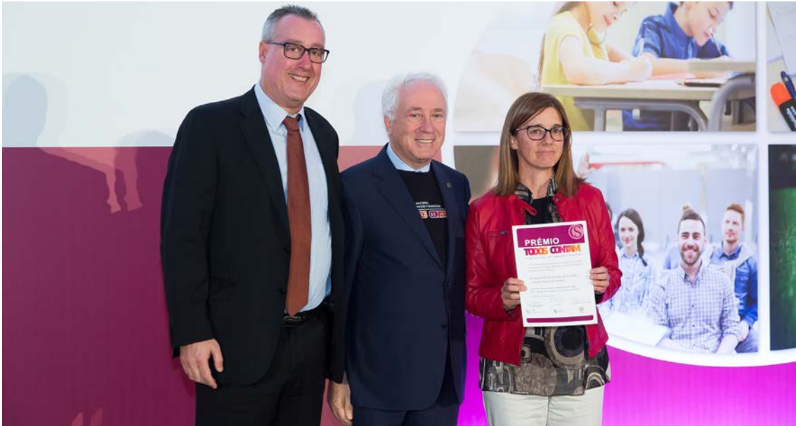
O Governador do Banco de Portugal, Carlos da Silva Costa, anuncia o prémio para o 1.º ciclo do ensino básico atribuído à Escola Básica de Pombal, do Agrupamento de Escolas de Pombal.