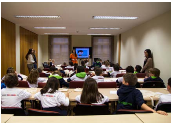
Iniciativas com os alunos do Colégio Heliântia, de Valadares (Vila Nova de Gaia), na Filial do Banco de Portugal, no Porto.

Os alunos do 7.º ano de escolaridade do Agrupamento de Escolas de Real participaram na sessão sobre “O Conhecimento da nota de Euro”, onde ficaram a conhecer os elementos de segurança das notas de euro. Participaram depois no jogo “Equilibra o orçamento”, em que responderam a questões sobre finanças pessoais para ajudar a equilibrar um orçamento.