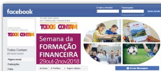
Divulgação da Semana da Formação Financeira 2018 na página de Facebook: https://www.facebook.com/TodosContam/