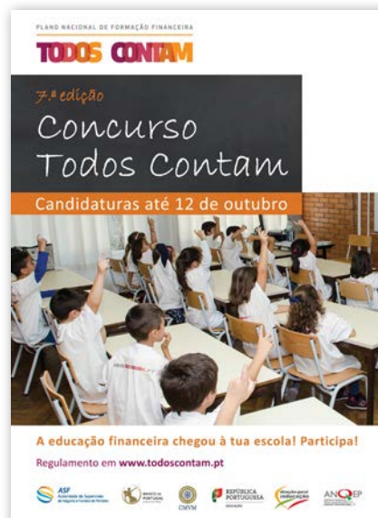
Cartaz de divulgação da 7.ª edição do Concurso Todos Contam.

Os projetos devem ainda reger-se pelos Princípios Orientadores das Iniciativas de Formação Financeira do Plano 5 , pelo que os candidatos não podem incluir iniciativas desenvolvidas em parceria com instituições do setor financeiro, a menos que tal ocorra através das respetivas associações setoriais.