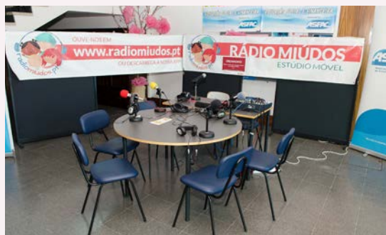
Iniciativas no espaço Orçamento.