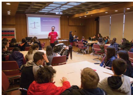
Iniciativas com os alunos do Agrupamento de Escolas de Real, de Braga, na Filial do Banco de Portugal, no Porto.

Ainda no dia 14 de março, a Comissão do Mercado de Valores Mobiliários, em parceria com a Euronext, recebeu 55 alunos do ensino secundário da Escola Profissional Vértice . Os alunos tiveram oportunidade de participar num conjunto de atividades lúdico-formativas, incluindo uma sessão de sensibilização sobre o mercado de capitais, as competências da CMVM, as características de alguns produtos financeiros (ações, obrigações, fundos de investimento), o funcionamento da bolsa de valores, a realização de inquéritos ao perfil de investidor, e de tocar o sino marcando o fecho dos mercados, um momento tradicional das celebrações da Global Money Week .