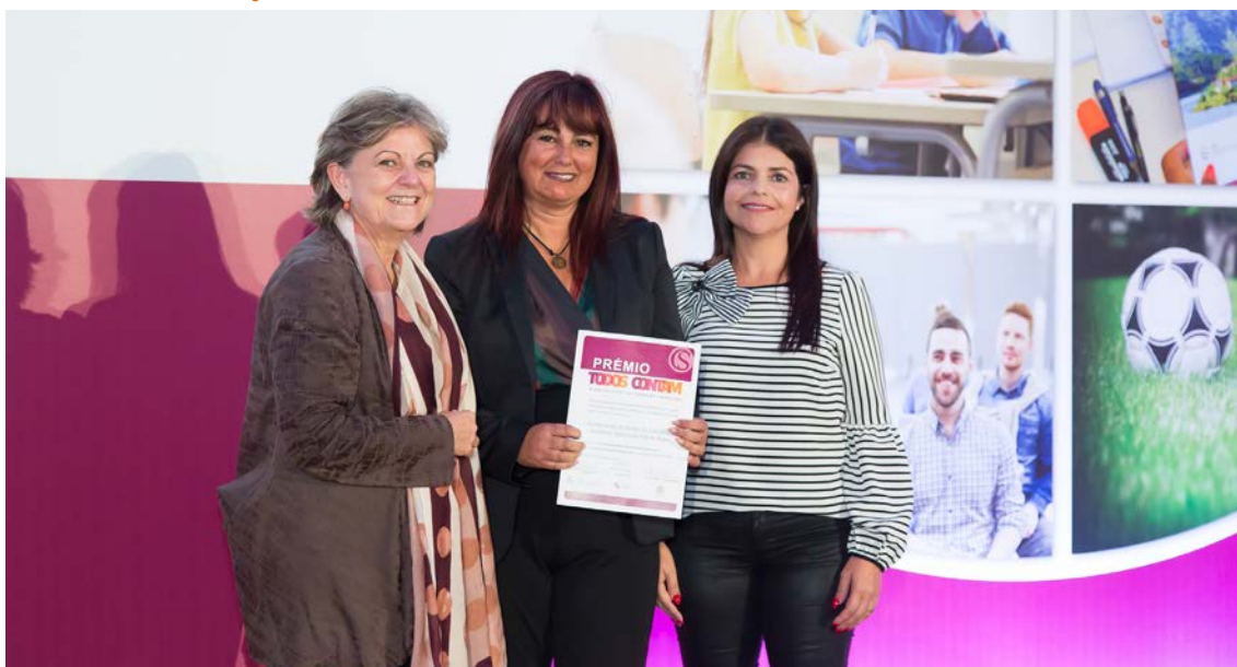
A Vice-Governadora do Banco de Portugal, Elisa Ferreira, anuncia o prémio para a educação pré-escolar atribuído ao Jardim de Infância da Vila do Bispo, do Agrupamento de Escolas da Vila do Bispo.