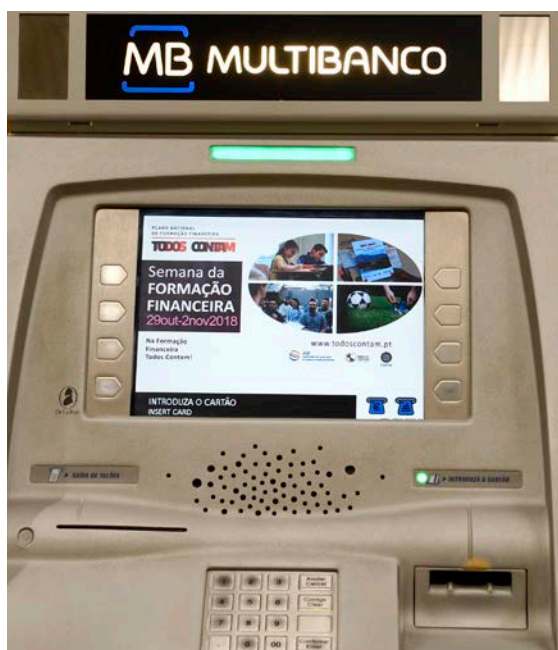
Divulgação da Semana da Formação Financeira 2018 nos caixas automáticos da rede Multibanco.

As atividades realizadas durante esta semana foram amplamente difundidas através do portal Todos Contam e da página do Facebook, para além da imprensa e rádios locais. Paralelamente, e com o apoio da SIBS, o evento foi também divulgado nos caixas automáticos da rede Multibanco.