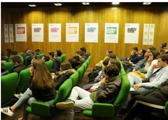
Iniciativas com os alunos da Escola Profissional Vértice (Paços de Ferreira), na Euronext, em Lisboa.

Ainda no dia 14 de março, a Comissão do Mercado de Valores Mobiliários, em parceria com a Euronext, recebeu 55 alunos do ensino secundário da Escola Profissional Vértice . Os alunos tiveram oportunidade de participar num conjunto de atividades lúdico-formativas, incluindo uma sessão de sensibilização sobre o mercado de capitais, as competências da CMVM, as características de alguns produtos financeiros (ações, obrigações, fundos de investimento), o funcionamento da bolsa de valores, a realização de inquéritos ao perfil de investidor, e de tocar o sino marcando o fecho dos mercados, um momento tradicional das celebrações da Global Money Week .