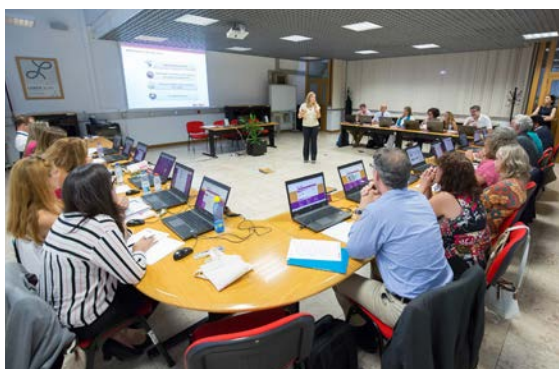
Primeiro curso de formação de formadores do IEFP em Lisboa.

Em novembro de 2018 teve lugar o segundo curso de formação dirigido a formadores do IEFP da região Norte, que se realizou na cidade do Porto.