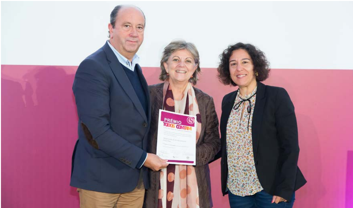
A Vice-Governadora do Banco de Portugal, Elisa Ferreira, anuncia o prémio de continuidade atribuído ao Agrupamento de Escolas General Serpa Pinto, de Cinfães.