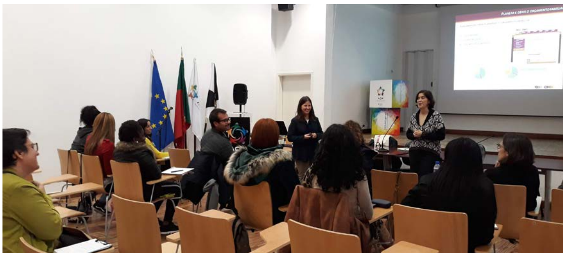
Formação de técnicos do Programa Escolhas do Alto Comissariado para as Migrações.

A convite do Programa Escolhas do Alto Comissariado para as Migrações, o Plano dinamizou uma ação de formação financeira, no dia 28 de novembro, dirigida a 11 técnicos do Programa Escolhas que trabalham com públicos vulneráveis. A ação foi dedicada ao planeamento e gestão do orçamento, nomeadamente a importância da sua elaboração, as etapas do orçamento e algumas dicas para controlo de despesas.