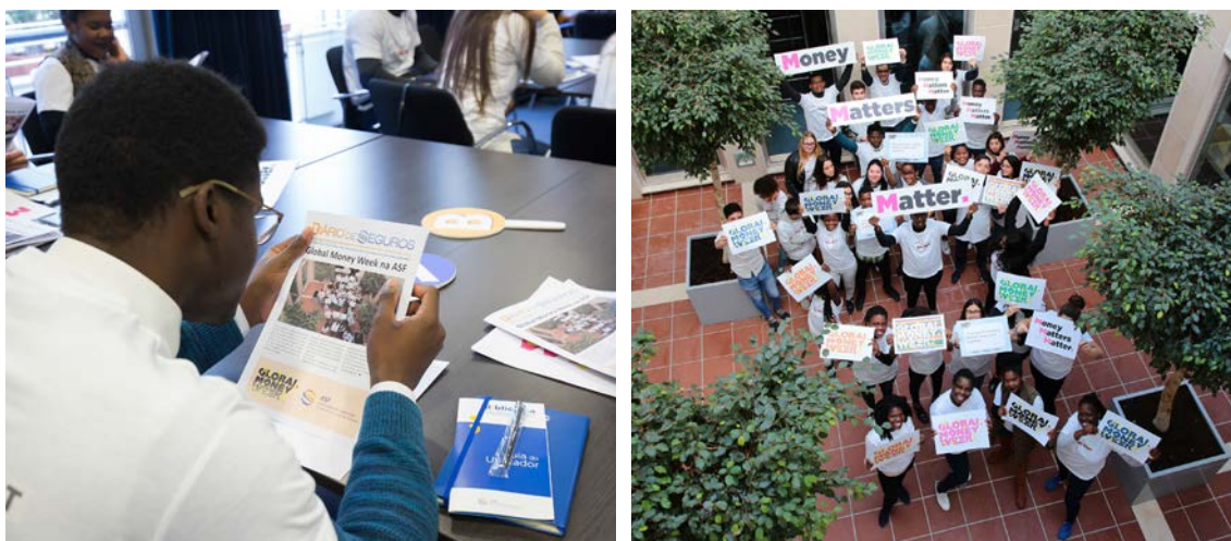
Iniciativas com os alunos do Instituto para o Ensino e Formação (Lisboa), na ASF, em Lisboa.

Foi também dinamizado o jogo “Segura-te bem”, que permitiu aos participantes testar os seus conhecimentos em matéria de seguros.