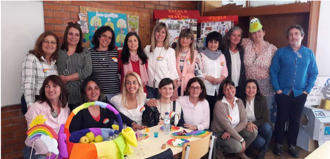
Oficina de formação na Escola EB 2,3 de Fernando Pessoa de Lisboa.