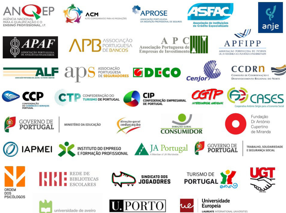
Membros da Comissão de Acompanhamento em 2018.

Para a implementação das atividades dinamizadas foi fundamental a colaboração dos parceiros do Plano, representados na Comissão de Acompanhamento.