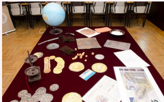
Iniciativas no espaço Sistema financeiro.