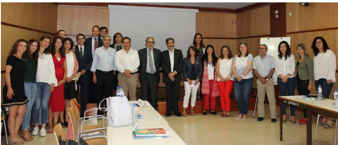
Ação de formação de formadores das autarquias do Alto Tâmega, em Chaves, em julho de 2018.

Ainda em 2018, todos os municípios da Comunidade Intermunicipal do Alto Tâmega participaram ativamente na Semana da Formação Financeira 9 com iniciativas e campanhas de sensibilização da população para a importância da formação financeira.