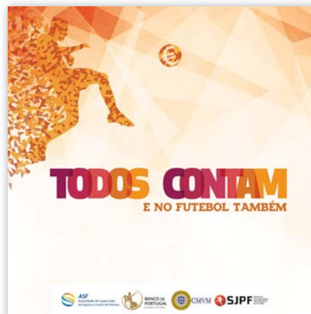
Brochura “Todos Contam. E no futebol também”, disponível no portal Todos Contam em: https://www.todoscontam.pt/sites/default/files/taxonomy_file/brochurasjpf_2.pdf

No âmbito da Semana da Formação Financeira 12 , o Sindicato dos Jogadores Profissionais de Futebol, com o apoio dos supervisores financeiros, organizou um workshop sobre a formação financeira do jogador de futebol com o objetivo de sensibilizar os jogadores de futebol para a importância da gestão financeira durante a carreira.