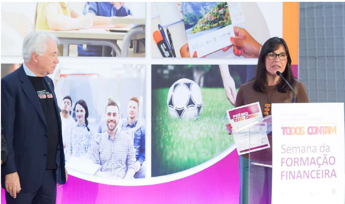
O Governador do Banco de Portugal, Carlos da Silva Costa, anuncia o prémio de continuidade atribuído ao Centro Educativo dos Olivais, de Coimbra.