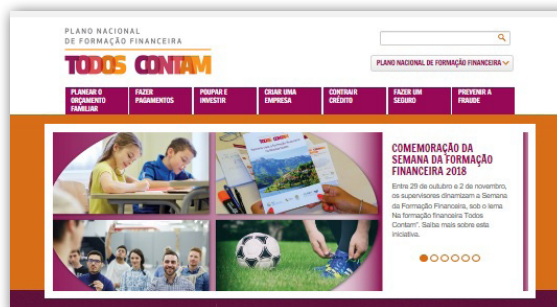
Divulgação da Semana da Formação Financeira 2018 no portal Todos Contam: www.todoscontam.pt