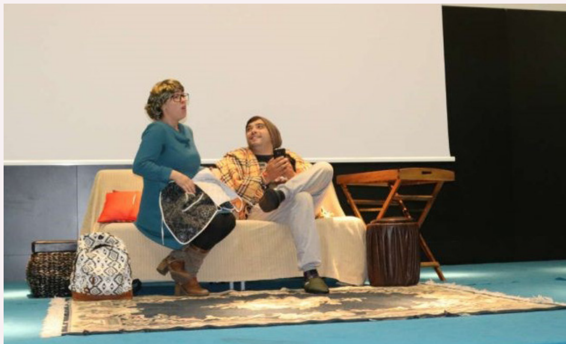
Peça de teatro “Contas mal contadas”, interpretada por dois atores baionenses.

O município de Baião associou-se, mais uma vez, à Semana da Formação Financeira através da dinamização de um momento cultural e didático. A peça de teatro “Contas mal contadas”, escrita e encenada por dois atores baionenses, foi representada em três agrupamentos de escolas do concelho, com a participação de cerca de 90 alunos. Esta peça aborda temas como a importância da poupança e a adoção de comportamentos financeiros adequados.