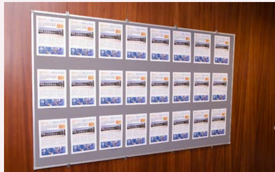
Iniciativas no espaço Risco.