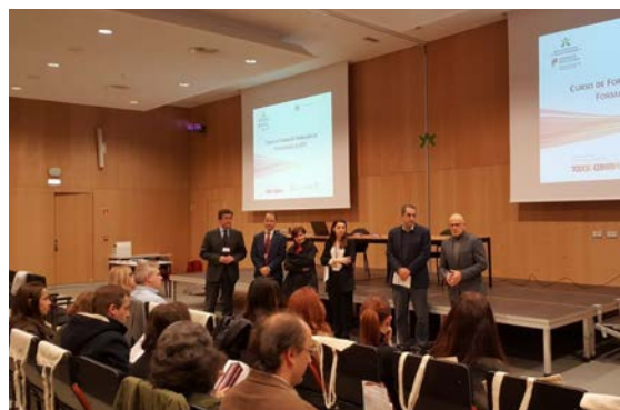
Segundo curso de formação de formadores do IEFP no Porto.

O programa de formação de formadores terá continuidade noutros pontos do país, por forma a garantir uma adequada distribuição regional destas ações.