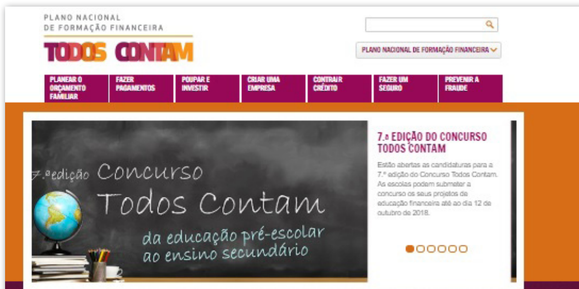
Lançamento da 7.ª edição do Concurso Todos Contam no portal Todos Contam.