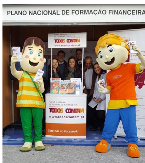
Ação de divulgação do Plano Nacional de formação Financeira na Feira dos Santos, em Chaves.

Participaram nestas iniciativas cerca de 300 pessoas, nas quais se incluem crianças, jovens, seniores, técnicos de ação social, grupos vulneráveis e população em geral.