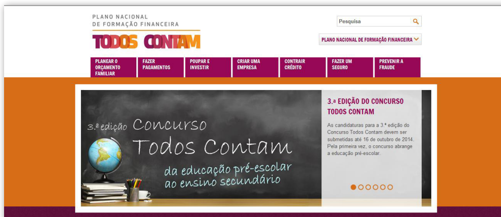
Lançamento da 3.ª edição do Concurso Todos Contam no portal Todos Contam.

Tendo por base o Referencial de Educação Financeira para a Educação Pré-Escolar, o Ensino Básico, o Ensino Secundário e a Educação e Formação de Adultos, os projetos candidatos deviam sensibilizar os alunos para a importância dos conhecimentos