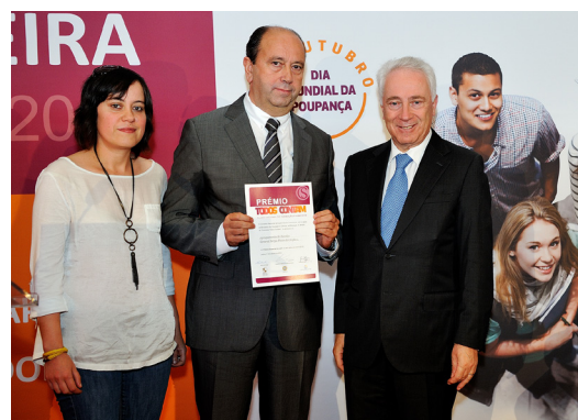
O Governador do Banco de Portugal, Dr. Carlos da Silva Costa, entrega o prémio especial do júri ao Agrupamento de Escolas General Serpa Pinto de Cinfães (distrito de Viseu).