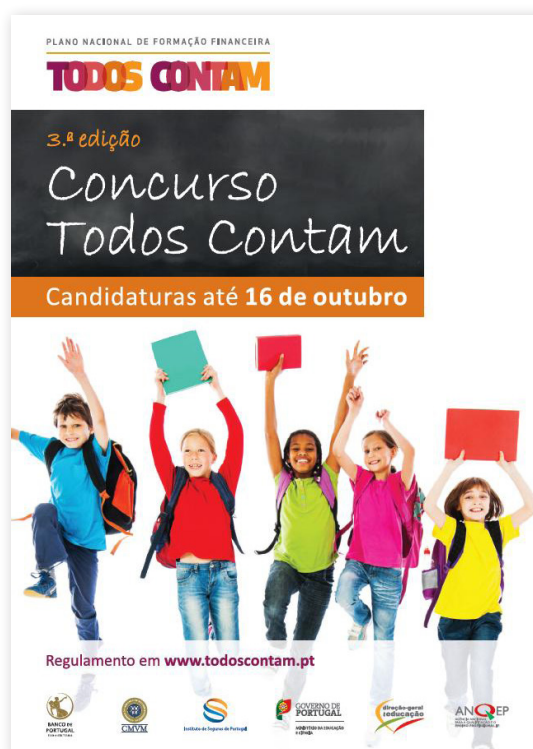
Cartaz de divulgação da 3.ª edição do Concurso Todos Contam.

A 3.ª edição do Concurso Todos Contam foi ainda divulgada na newsletter de setembro do portal Todos Contam.