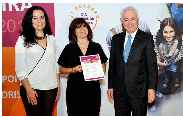
O Governador do Banco de Portugal, Dr. Carlos da Silva Costa, entrega o prémio do 1.º ciclo do ensino básico à Escola Básica Conde de Vilalva, do Agrupamento de Escolas n.º 4 de Évora (distrito de Évora).